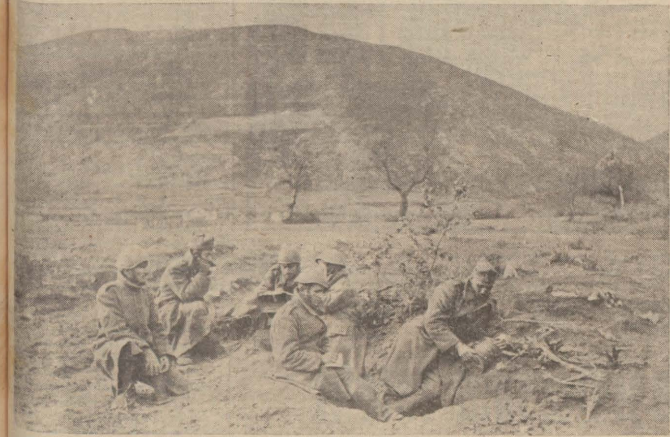
Arnavudlukta Pogradeç ilerisinde bir Yunan ileri muhabere müfrezesi