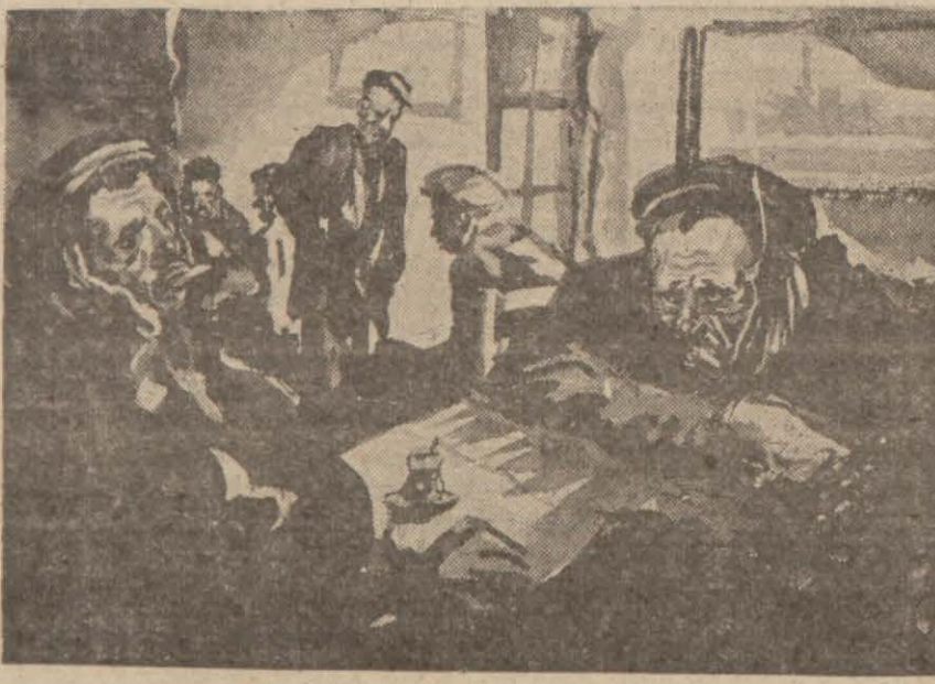
— 1 — Saatlerin akreleriyle yelkovanları dikleri sularında... Tophanenin, suyu çekilmiş nehir yatağını andıran ca- (Devamı 6 nci sayfada)

Yeni Tarihî Romanımız Yani Kaloyaninin Kızı 600 sene evvelki devrin dekoru içinde geçen çok heyecanlı bir aşk macerasının hikâyesi Yazan: Reşad Ekrem